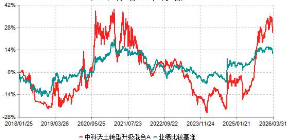
中科沃土转型升级混合A累计净值增长率与业绩比较基准收益率历史走势对比图 (2018年01月25日-2026年03月31日)