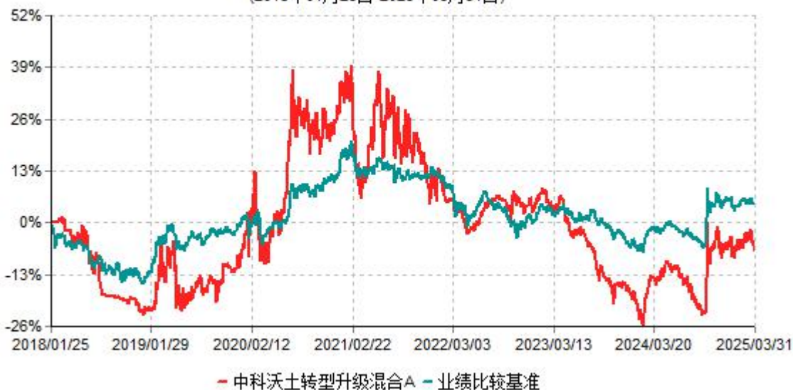
中科沃土转型升级混合A累计净值增长率与业绩比较基准收益率历史走势对比图 (2018年01月25日-2025年03月31日)