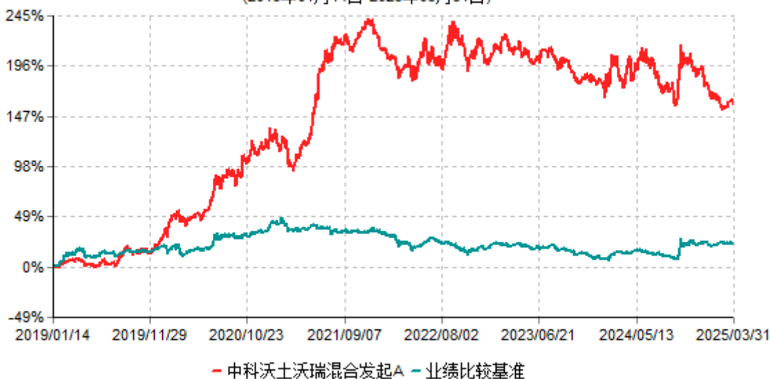
中科沃土沃瑞混合发起A累计净值增长率与业绩比较基准收益率历史走势对比图 (2019年01月14日-2025年03月31日)